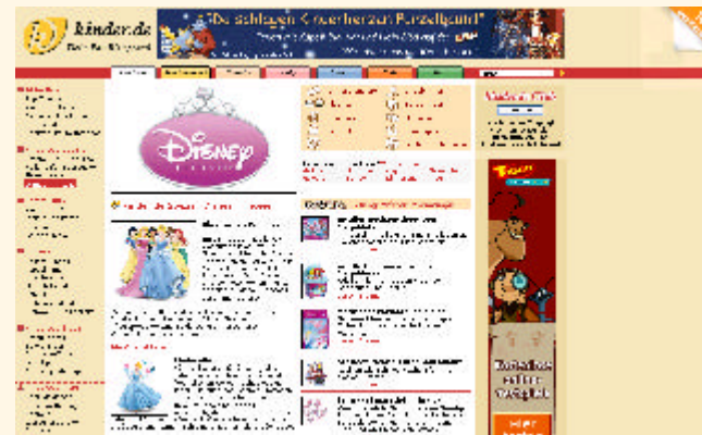
Contentseite im kinder.de Spezial Bereich

kinder.de bietet ein umfassendes Angebot für Eltern, welches sie über den gesamten Zeitraum des Erwachsenwerdens ihrer Kinder begleitet (= von der Schwangerschaft bis zum Eintritt ins Berufsleben).